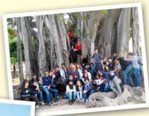
Istituto Bertoni di Udine Dicembre 2010