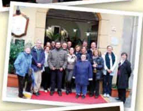
Liceo Leopardi di Lecco Marzo 2011