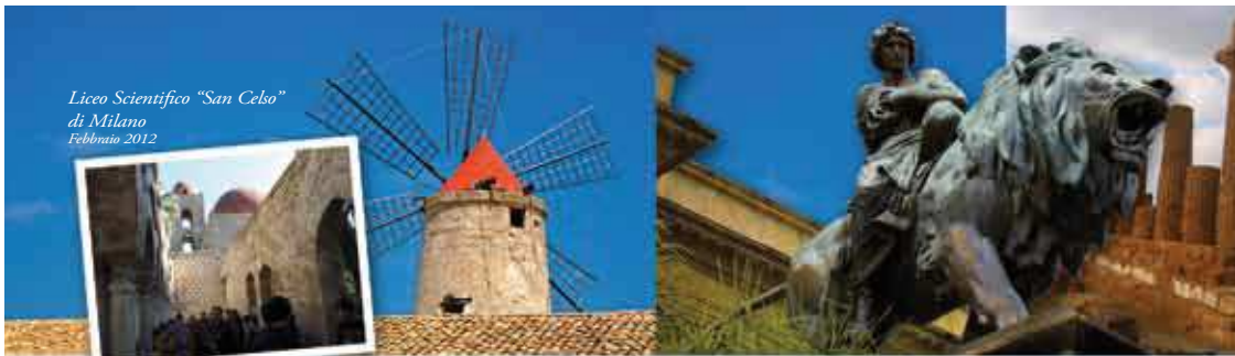
Liceo Scientifico "San Celso" di Milano Febbraio 2012