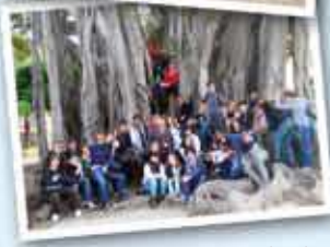
Istituto "Bertoni" di Udine Dicembre 2010